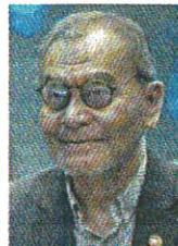
Dr Dzulkefly Ahmad

"Antara inisiatif aspek latihan bagi meningkatkan bilangan pakar perubahan secara keseluruhan adalah meletakkan slot tajaan Hadiah Latihan Persekutuan daripada 1,500 slot setiap tahun kepada 1,650 slot pengajian bagi sesi 2024/2025.