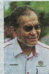
Datuk Seri Dr Dzulkefly Ahmad